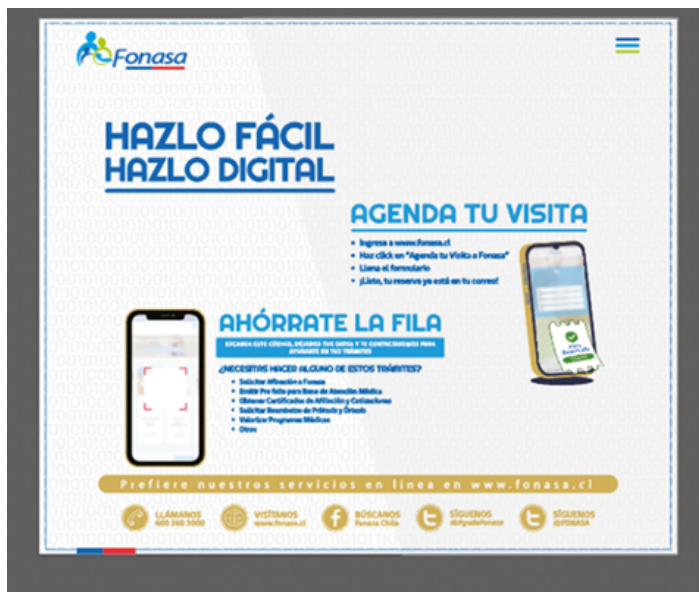
DUSTED GRIS LISO 60% 200 X 80 CM INSTALADO EN TOMÉ