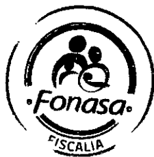
LUIS BRITO ROSALES FISCAL FONDO NACIONAL DE SALUD